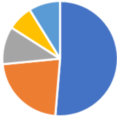
Распределение общего количества убытков по величине убытка 2010-2020

■ до 1 млн ■ 1-3 млн ■ 3-5 млн ■ 5-10 млн ■ более 10 млн