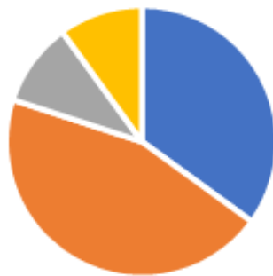
Распределение убытков по видам нарушений 2010-2020